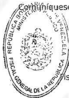
TAREK WILLIANS SAAB Fiscal General de la República